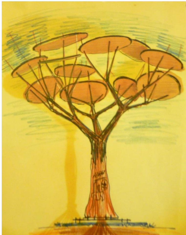
Projet Bilal HASSAN & Nicolas PAUL

« ...L'architecture majestueuse des arbres capte notre attention. L'arbre est intrinsèquement lié à l'humain : la nature est ce lien digne d'admiration. L'arbre symbolise l'identité de l'homme...La sculpture représentera un tronc d'arbre sculpté en reliefs inspirés par les échanges sur place (des éléments de l'histoire de la commune, des habitants, des lieux spécifiques représentés, pourquoi pas une carte de la région...). Vingt-sept barres d'acier doux de diamètre 15mm seront soudées ensemble, assemblées de façon à prolonger le tronc sur environ 30 à 90 cm de haut. Ces 27 barres seront ensuite pliées par 3 lots de 9 barres chacun... Chacun des lots sera ensuite de même divisé en 3... Enfin, ces 9 branches s'ouvriront en 27 branchettes... »