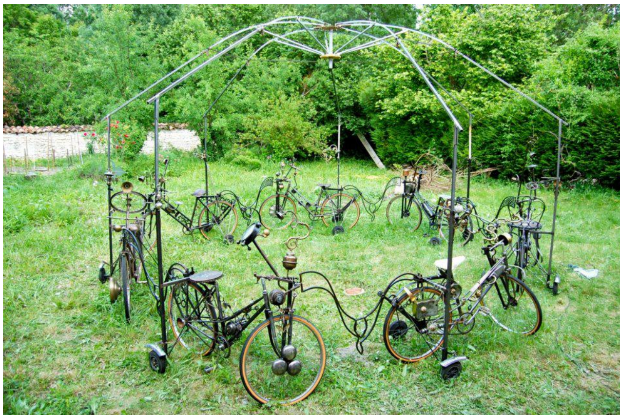
Le décor en cours d'élaboration.

Dans le cadre de cet accueil, les comédiens de la compagnie P'ti Tom proposeront deux interventions auprès des élèves de l'école primaire de Bréville. Ils leurs présenteront le métier de comédien. Les enfants pourront imaginer et interpréter quelques scénettes autour du conte. Ils participeront également à une répétition.