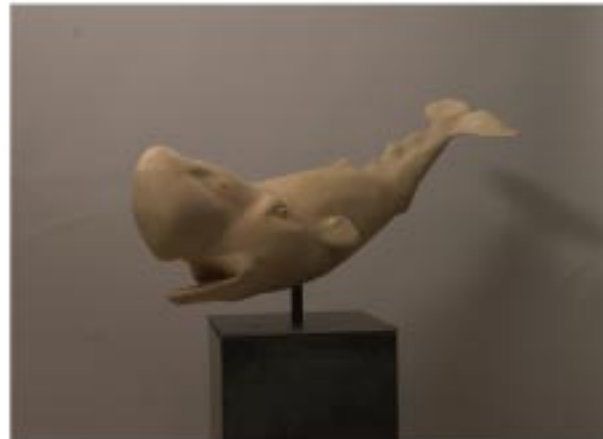
Cachalot Tilleul et acier, 110*64*47 cm.