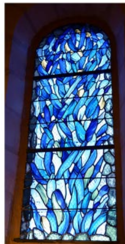
Eglise de Cissé (86), 202 x 75 cm Verres soufflés, grisaille, plomb