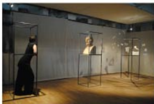
Homère, Homères Chêne, acier, plâtre et résine d'inclusion. Installation 7,1*2,07*2,9 m. Buste 32*40*66 cm.