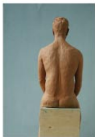
Nu masculin Terre cuite, 68*21*28 cm.