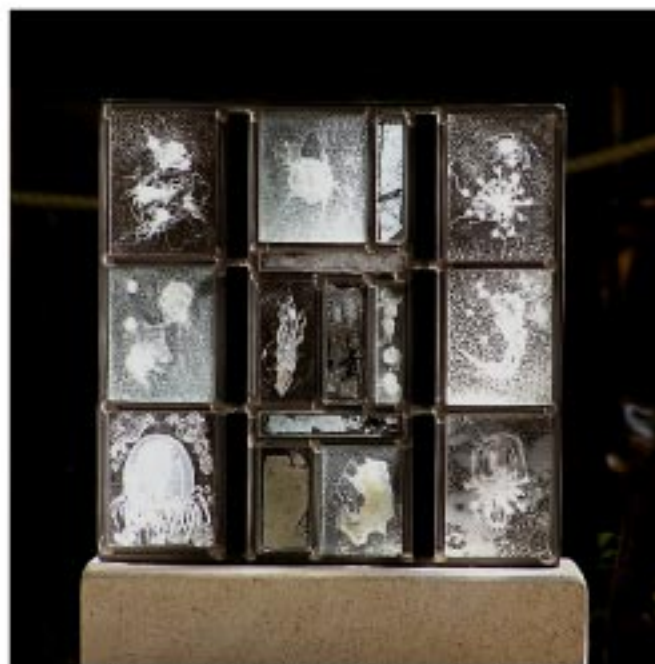
«Abysses Blancs», 35 x 35 cm (sans le socle) Verre, inclusions végétales fusionnées, plomb