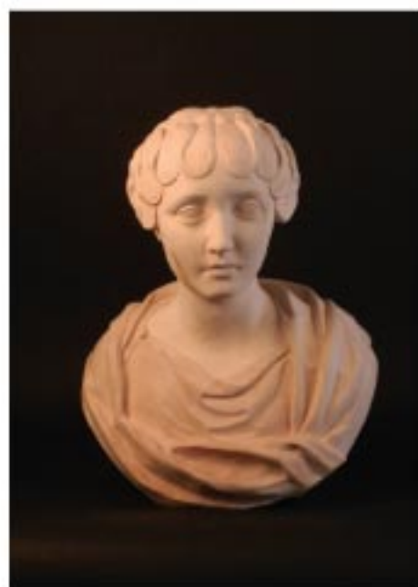
Buste féminin renaissance Tilleul, 71*52,5*41 cm.