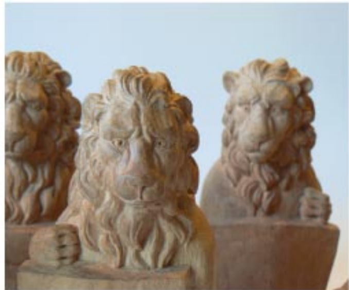
Lions Renaissance Atelier Boulnois, chêne, 18*8,5*9,5 cm.