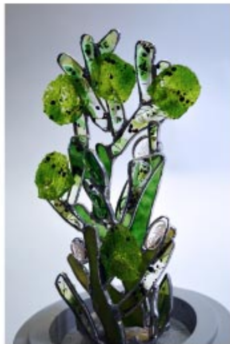
«Corail mousse», 22 x 12 cm Verre, technique tiffany, fusing, grisaille