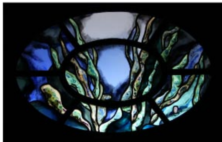
«Mobilis in Mobile», 110 x 70 cm, Verres soufflés, grisaille, fusing, plomb