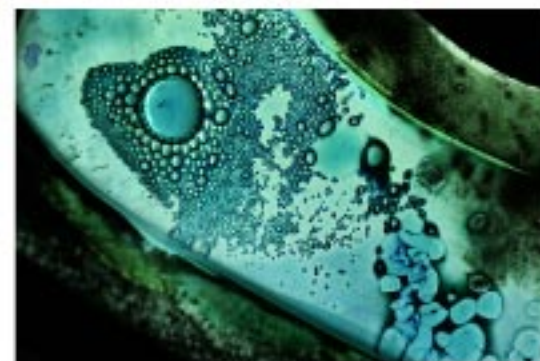
«Mobilis in Mobile», détail fusing