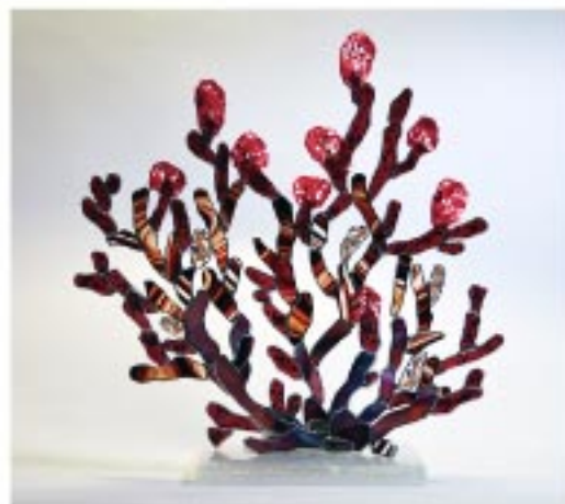
«Gorgone aux hippocampes», 34 x 32 cm Verre, technique tiffany, grisaille, fusing